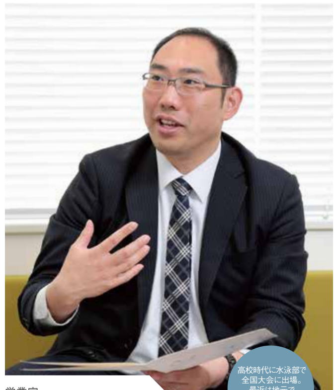
営業室 営業チーム

学生時代は インスタレーション (空間芸術)に没頭。 今のマイブームは 「お惣菜の作り置き」